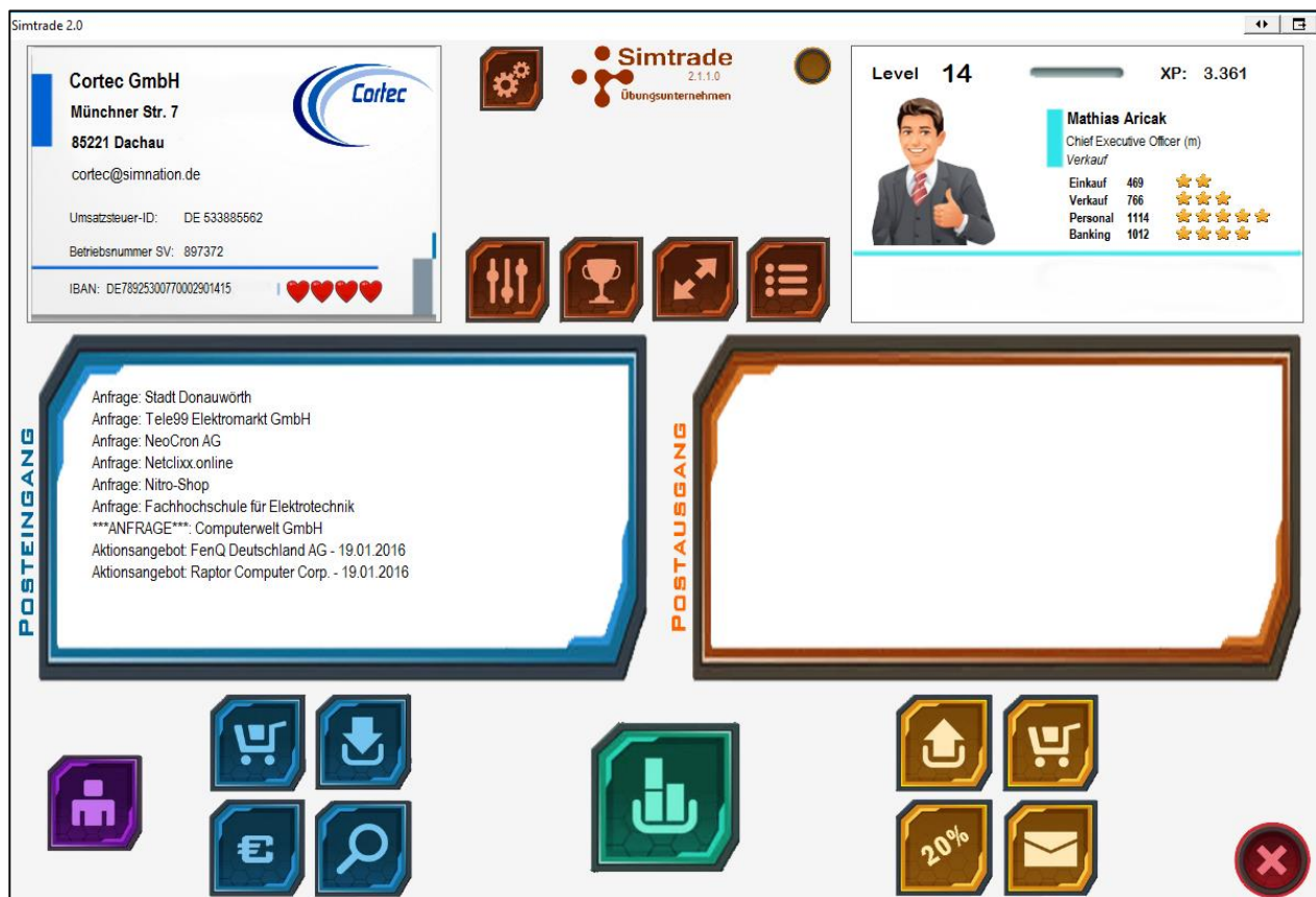
Hauptbildschirm mit Posteingang und -ausgang, Unternehmensinfo, Visitenkarte des Mitarbeiters und Funktionskacheln